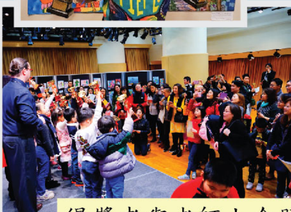
得獎者與老師大合照