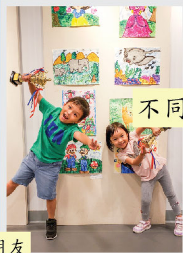
不同組別的得獎者