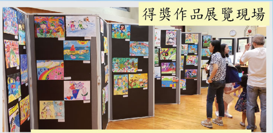
參賽者們的努力獲得嘉許