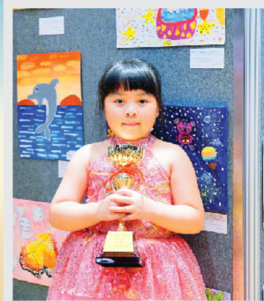
INTERNATIONAL OPEN VISUAL ARTS